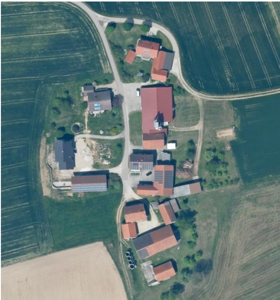
Luftbild Landesamt für Vermessung und Geoinformation Bayern

Planverfasser: Manfred Preitenwieser, Planungsbüro für Hochbau Kellerweg 16, 84494 Neumarkt-Sankt Veit Tel: 08639-8333 info@preitenwieser